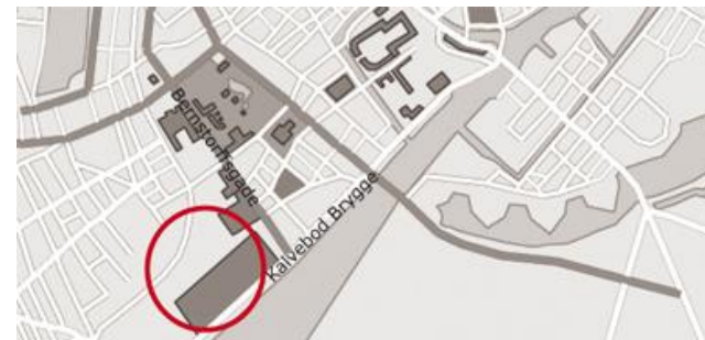
Rigsarkivet i København